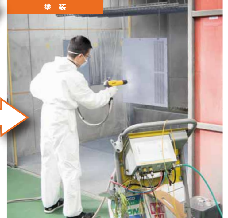
熟練の職人が丁寧に仕上げます。