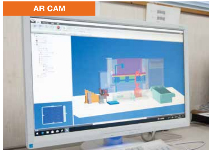
アマダ製自動プログラミング CAD にてデータ作成。