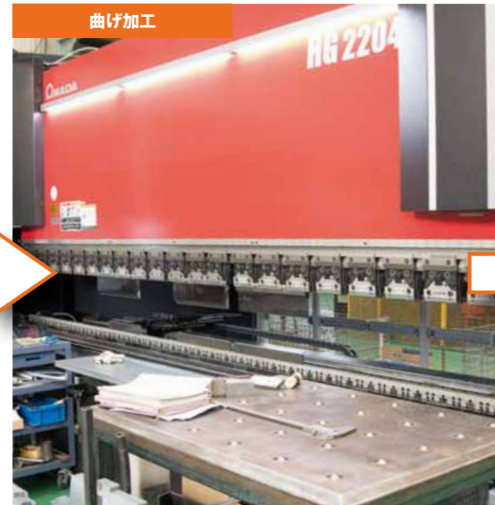
熟練の技術者が、図面に忠実に加工を行います。