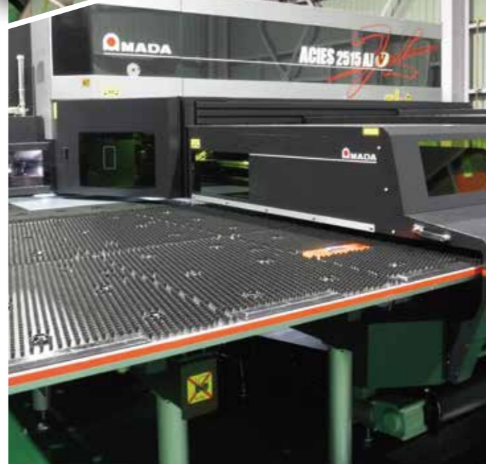
タレバン・レーザー複合機・レーザーにより必要な形状に加工。