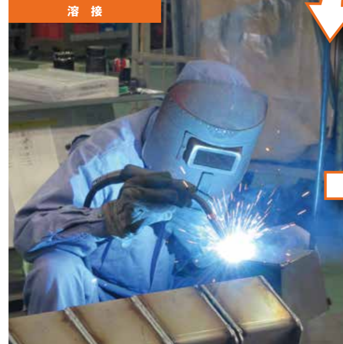
国家資格保有技術者が図面通りに組上げます。